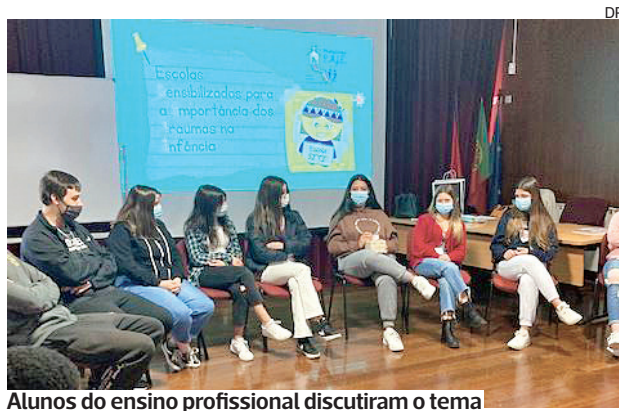
Alunos do ensino profissional discutiram o tema