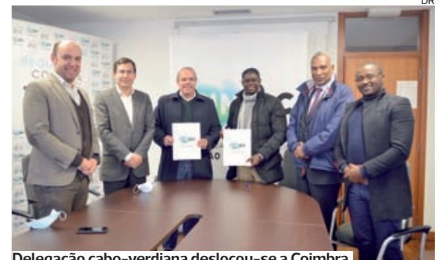
Delegação cabo-verdiana deslocou-se a Coimbra